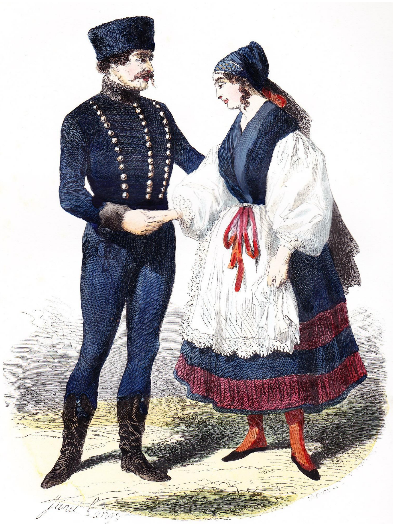
MAGYARS DE IÁSZBERÉNY.